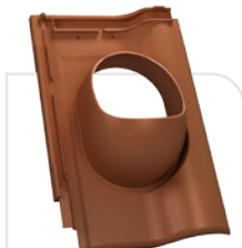
P18-12 ROBEN / monza plus