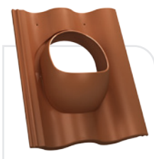
P18-08 BENDERS / podwójna S