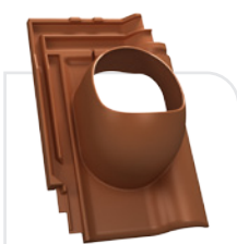
P18-13 KORAMIC / renesansowa L15