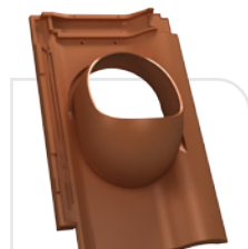
P18-16 ROBEN / piemont