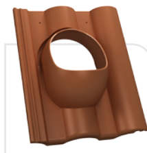
P18-10 NELSKAMP / do krycia koronowego