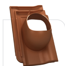
P18-11 ROBEN / fleming