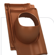
P18-18 TONDACH / holenderka 11