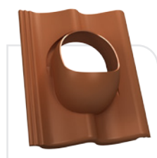
P18-01 EURONIT / profil S

DO DACHÓWEK BETONOWYCH, CERAMICZNYCH system WiroVent®, WiroVent®Pro