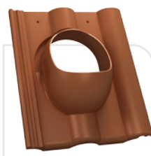
P18-09 NELSKAMP / finkenberger IBF / podwójna rzymska