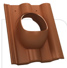
P18-02 EURONIT / extra