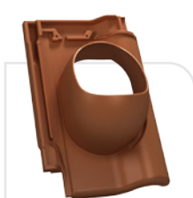
P18-17 BRASS / amber