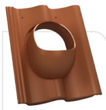
P18-03/150 BRAAS / bałtycka S IBF / podwójna S NELSKAMP / esówka S PRODACH / podwójna esówka